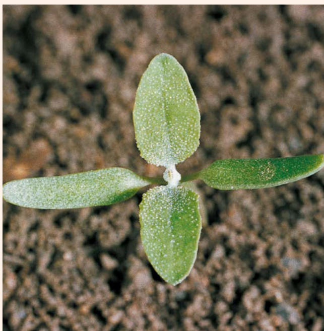
Faza 2 liści właściwych komosy białej.

Jeśli chwastem wskaźnikowym jest komosa biała ( Chenopodium album ), momentem krytycznym, a zarazem najwyższej wrażliwości komosy na herbicyd CONVISO ONE, jest czas, kiedy na polu większość roślin komosy osiągnęła fazę dwóch liści właściwych. Ważne, aby pierwsze dwa liście komosy były już rozłożone i mogły pełną powierzchnią przyjąć herbicyd. W ten sposób uzyskuje się optymalną skuteczność CONVISO ONE. Zbyt wczesny zabieg (kiedy tylko liście się pojawiają i są jeszcze wyszorcowane) będzie znacznie mniej efektywny. Jeśli komosa biała nie występuje na polu, należy wybrać inny masowo występujący chwast jako wskaźnikowy.