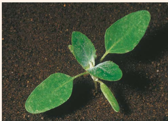
Faza 4 liści właściwych komosy białej.

Po wykonaniu I zabiegu pole trzeba monitorować tak, aby trafić optymalnie z II zabiegiem :