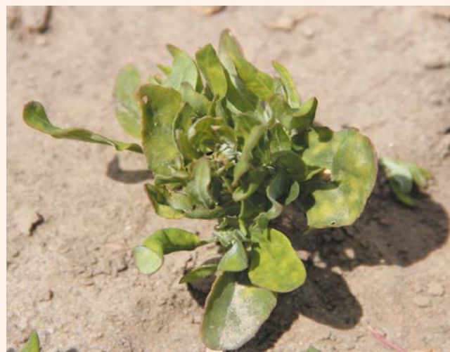
Komosa biała – efekt bonsai.

Zastosowanie dawek dzielonych wykazało skuteczniejszą kontrolę chwastów, ponieważ później pojawiające się chwasty można łatwiej zwalczyć drugim zabiegiem.